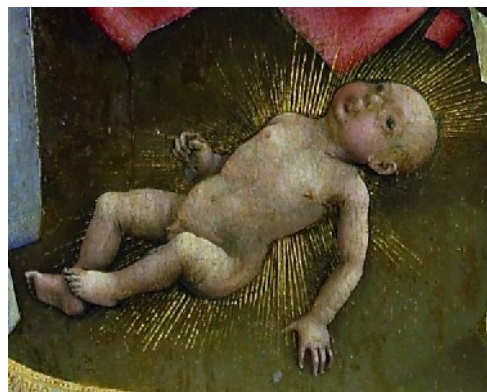
La Nativité, détail

Pourtant cette scène de La Nativité n'est pas totalement ancrée dans le réalisme et elle garde, pour souligner son caractère sacré, des signes de «l'au-delà». Ainsi l'enfant Jésus est entouré d'un léger rayonnement. La scène est survolée par un groupe de trois anges tenant des phylactères avec les paroles du Gloria . Un autre ange flotte au dessus du couple sacré. Les personnages des sages-femmes sont entourés de phylactères.