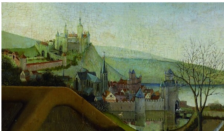
La Nativité, détail

Le message de la Nativité est «Dieu fait homme parmi les hommes». Peut-être le peintre cherche-t-il à montrer que Dieu est encore présent parmi les hommes du XV e siècle. Quelques signes pourraient conforter cette hypothèse tel le chemin qui relie le premier à l'arrière plan, ou les repères religieux de cet arrière plan (église, béguinage...).