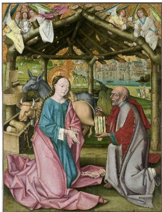
Le Maître de Sarnen, La Nativité , vers 1460

Le sacré est donc bien présent dans le tableau de la Nativité du Maître de Flémalle. Le choix même de la scène, avec les deux personnages de Marie et de Jésus au moment de sa naissance, souligne le côté humain de ses protagonistes religieux. La représentation naturaliste facilite l'empathie avec les personnages.