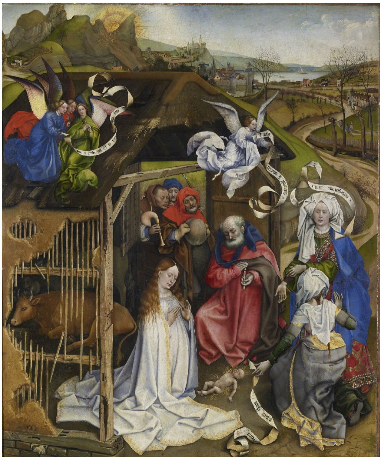
Le Maître de Flémalle, La Nativité , vers 1435, huile sur bois, H86 L 72 cm

DOSSIER D'ACCOMPAGNEMENT A DESTINATION DES ENSEIGNANTS DU SECOND DEGRE