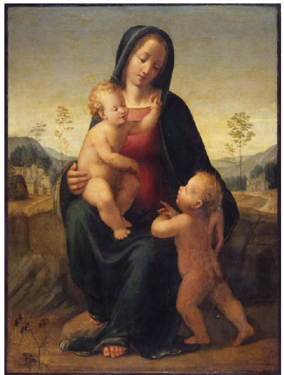
Francesco Franciabigio (?) La Vierge, l'Enfant et saint Jean-Baptiste , 1510 (photographie après restauration)