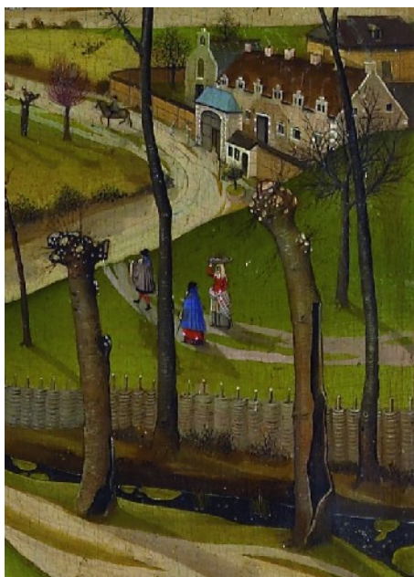
La Nativité, détail : le béguinage

fidèlement et précisément un paysage tel qu'il pouvait lui-même en observer, ce qui est véritablement nouveau à cette époque. Le regard y pénètre par l'intermédiaire d'un chemin qui serpente à partir de l'étable, pour s'enfoncer dans la profondeur d'un arrière-plan riche de nombreux détails. Il est composé d'arbres taillés et dénudés