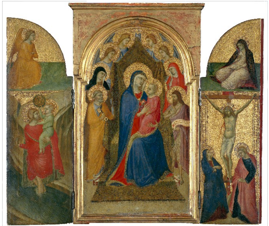
Pietro Lorenzetti, Triptyque , vers 1340 au centre : Vierge à l'Enfant entourée d'anges et de saints Volet gauche : Ange de l'Annonciation – Saint Christophe Volet droit : Vierge de l'Annonciation - Crucifixion

Repérons-les à la lumière d'une comparaison avec deux œuvres du musée : La Vierge et l'Enfant entourés de quatre anges, deux saintes, saint Pierre et saint Jean-Baptiste de l'atelier de Pietro Lorenzetti (vers 1340) pour les archaïsmes et Moïse sauvé des eaux de Véronèse (vers 1580) ou La Vierge, l'Enfant et saint Jean-Baptiste (1510) attribué avec incertitude à Francesco Franciabigio (visible à partir de 2013) comme exemple d'une œuvre de la Renaissance.