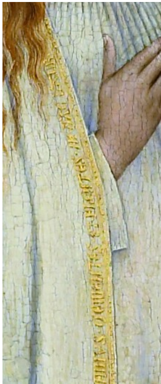
La Nativité , détail sur le manteau de Marie

Le message premier de cette nativité est le caractère sacré de Marie représentée dans le tableau avec un habit blanc, rappelé par celui de l'ange. Ce type de représentation est alors exceptionnelle puisque ce n'est véritablement qu'à partir du XIX e siècle que Marie est vêtue de blanc. Au Moyen Age, la Vierge porte plutôt une robe rouge et un manteau bleu. Si elle est ici vêtue de blanc c'est parce que la maître de Flémalle se réfère