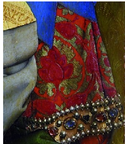
La Nativité, détail

Cette vision humanisée des personnages de la scène a un sens. Leur essence sacrée n'est plus imposée. La religion cherche moins à jouer sur les peurs (par exemple de l'enfer) ou sur l'explication des récits. Elle cherche à susciter chez le spectateur des émotions et une identification.