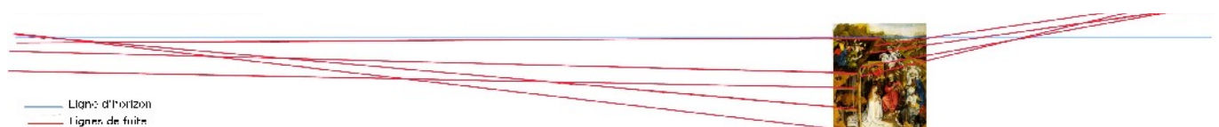
Une perspective linéaire approximative