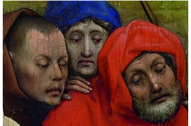
La Nativité, détail

Dans le triptyque Lorenzetti , tous les personnages ont un visage similaire. A cette époque chaque artiste se crée un visage-type sans expression, qu'il applique à tous les personnages. Dans La Nativité , Moïse sauvé des eaux ou dans La Vierge, l'Enfant et saint Jean-Baptiste , les visages sont différenciés et expressifs ; l'artiste a représenté des individus animés par leurs émotions.