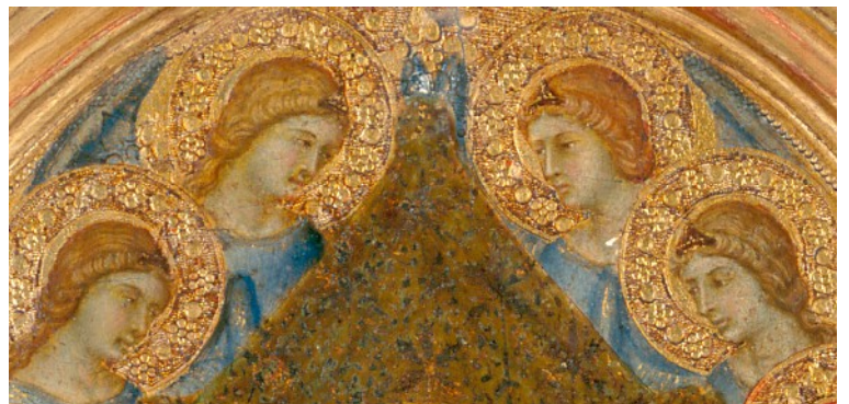
Triptyque Lorenzetti, détail du panneau central

Dans le triptyque Lorenzetti , les visages sont ceints d'imposantes auréoles dorées. Dans La Nativité , les auréoles ont disparu ; dans La Vierge, l'Enfant et saint Jean-Baptiste , elles sont à peine visibles.