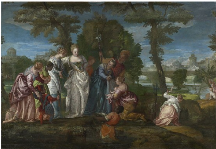
Paolo Caliari dit Veronèse, Moïse sauvé des eaux , vers 1580