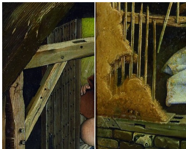
La Nativité, détails

Le décor immédiat de la Nativité est une étable qui reprend totalement les techniques de construction du XV e siècle. Le toit de chaume est finement dessiné puisque l'on peut presque distinguer chaque brin de paille et ainsi voir la texture de la couverture. La paroi à demi effondrée permet de reconnaître la technique alors en usage du torchis, avec les poutres et le clayonnage en bois sur lequel est disposé un mélange de terre et de fibres (végétales ou animales comme le crin de cheval). Le souci du détail réaliste est tel que l'on peut même voir les chevilles d'assemblage des pièces de bois et les encoches des mortaises. Une fois de plus, celui qui au XV e siècle regarde l'œuvre se trouve plongé dans son environnement quotidien, la scène lui devient alors plus familière et plus accessible.