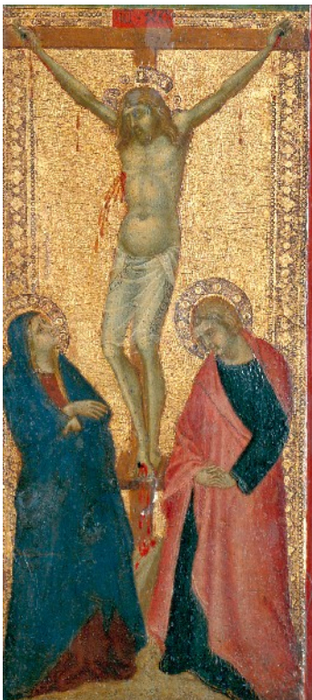
Triptyque Lorenzetti, détail du volet droit

Dans La Nativité , une des sages-femmes est représentée de dos. Le Maître de Flémalle a peut-être eu connaissance des expériences de Giotto qui, en précurseur, a commencé un siècle auparavant à peindre des personnages de dos. Un des volets du triptyque Lorenzetti montre que cette représentation de dos n'est pas une évidence au XIV e siècle. La Vierge regarde le Christ en croix, elle devrait donc tourner le dos au spectateur (elle est placée à côté de la croix donc elle lève juste la tête légèrement tournée sur le côté). Pourtant l'artiste l'a représentée de trois quart, tournée vers nous. Cette configuration est irréaliste, mais ainsi son visage demeure visible et la Vierge identifiable.