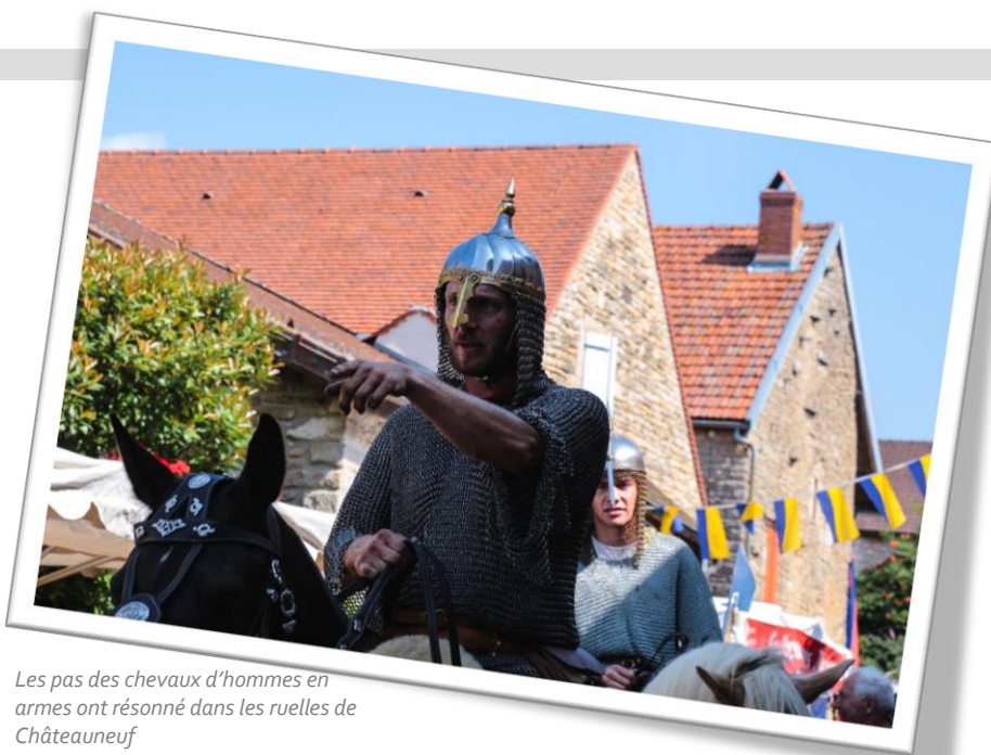
Les pas des chevaux d'hommes en armes ont résonné dans les ruelles de Châteauneuf

Sur les places et dans les rues et ruelles du bourg, ce sont plus de soixante échoppes d'artisans, qui ont fait découvrir au public des métiers oubliés, et des produits d'autrefois.