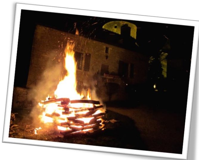
Le grand feu de bois illumine la place du Général Blondeau, sur le parvis de l'église Saint-Jacques et Saint-Philippe

Telle que les Amis de Châteauneuf la célèbrent depuis 1956, et pour le plus grand bonheur des Castelnoviens et des visiteurs, habitués ou occasionnels, ce fut une belle soirée de Noël !